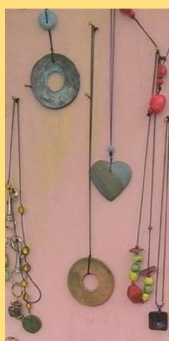
Collane e ornamenti

sono i manufatti usciti dai laboratori di creta, carta riciclata ed erbe officinali. In occasione di mercatini soprattutto nel periodo natalizio li esponiamo negli stand allestiti dal Centro o dall'Associazione.